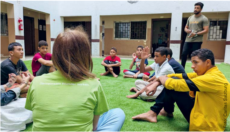
2025 schulte die Caritas Österreich die Teams vor Ort intensiv zu Gewaltprävention und Kinderschutz. Die Methoden fließen direkt in die tägliche Arbeit ein.