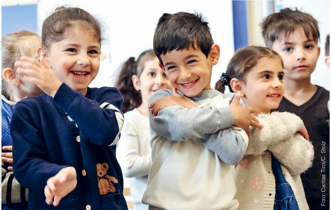
Kinder in Armenien erhalten gesunde Ernährung sowie Schutz, Bildung und Stabilität.

Armenien. In Armenien sind Kinder in großem Ausmaß von Armut betroffen. Ein Projekt in Kindergärten hilft.