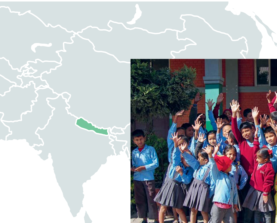
Die Mamta Rani Schule in Kathmandu ermöglicht Kindern aus armen Familien den Zugang zu Bildung.

Das Vertrauen der Gemeinschaft wächst: Im Schuljahr 2024/25 besuchten schon 87 Kinder im Alter von fünf bis vierzehn Jahren die Schule. Zu Beginn war es gerade einmal ein Dutzend. Doch mit dem Erfolg wachsen auch die Kosten. Und die Sorge um ihre Zukunft – insbesondere für jene 20 Kinder aus extrem armen Familien, die sich selbst den symbolischen Beitrag nicht leisten können. Für sie springt die Caritas ein und hilft damit, Bildung dort zu sichern, wo zwar der Boden oft bebt – sie aber für gute Zukunftschancen unverzichtbar bleibt. ■