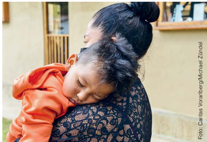
Nach traumatischen Erlebnissen erfahren Mütter und ihre Kinder hier Liebe, Zuwendung und Wertschätzung.

Wo: Cuenca, Ecuador Was: Zufluchtsstätte für Frauen und Kinder, psychologische Betreuung, gesundheitliche Versorgung, schulische Hilfe, Rechtsbeistand Partnerorganisation: Fundación Maria Amor