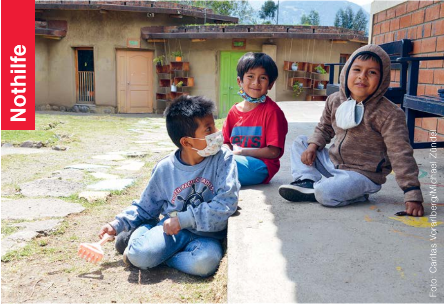
107 Kinder und Jugendliche fanden 2025 im Frauen- und Kinderhaus mit ihren Müttern Zuflucht.