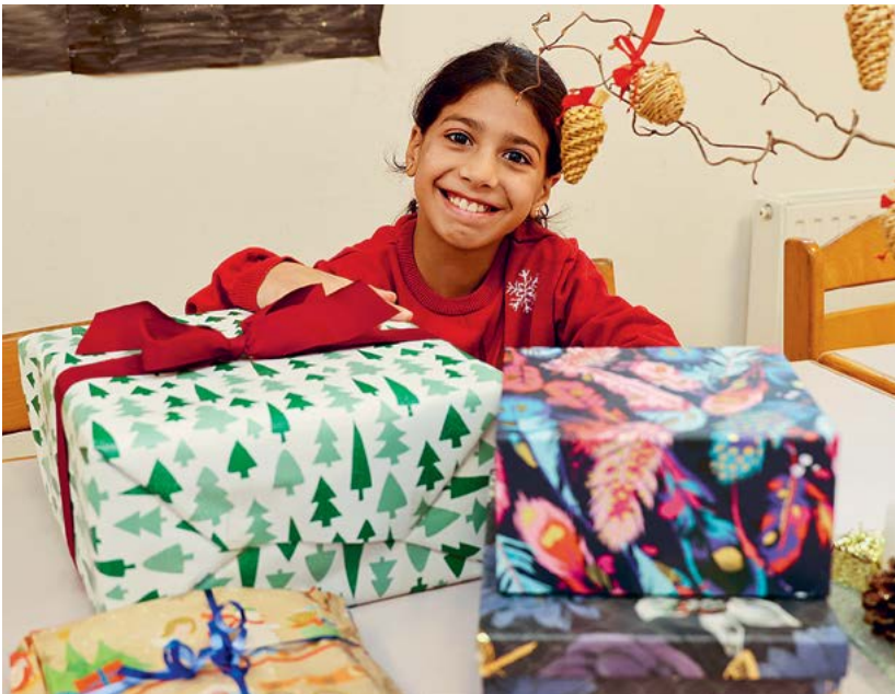
Zahlreiche Kinderaugen wurden bei der Christkindl-Aktion zum Leuchten gebracht.