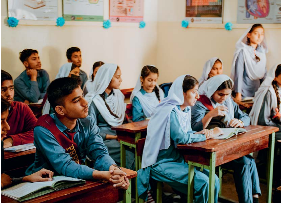
Schüler*innen in der Schule Khameeso Goth