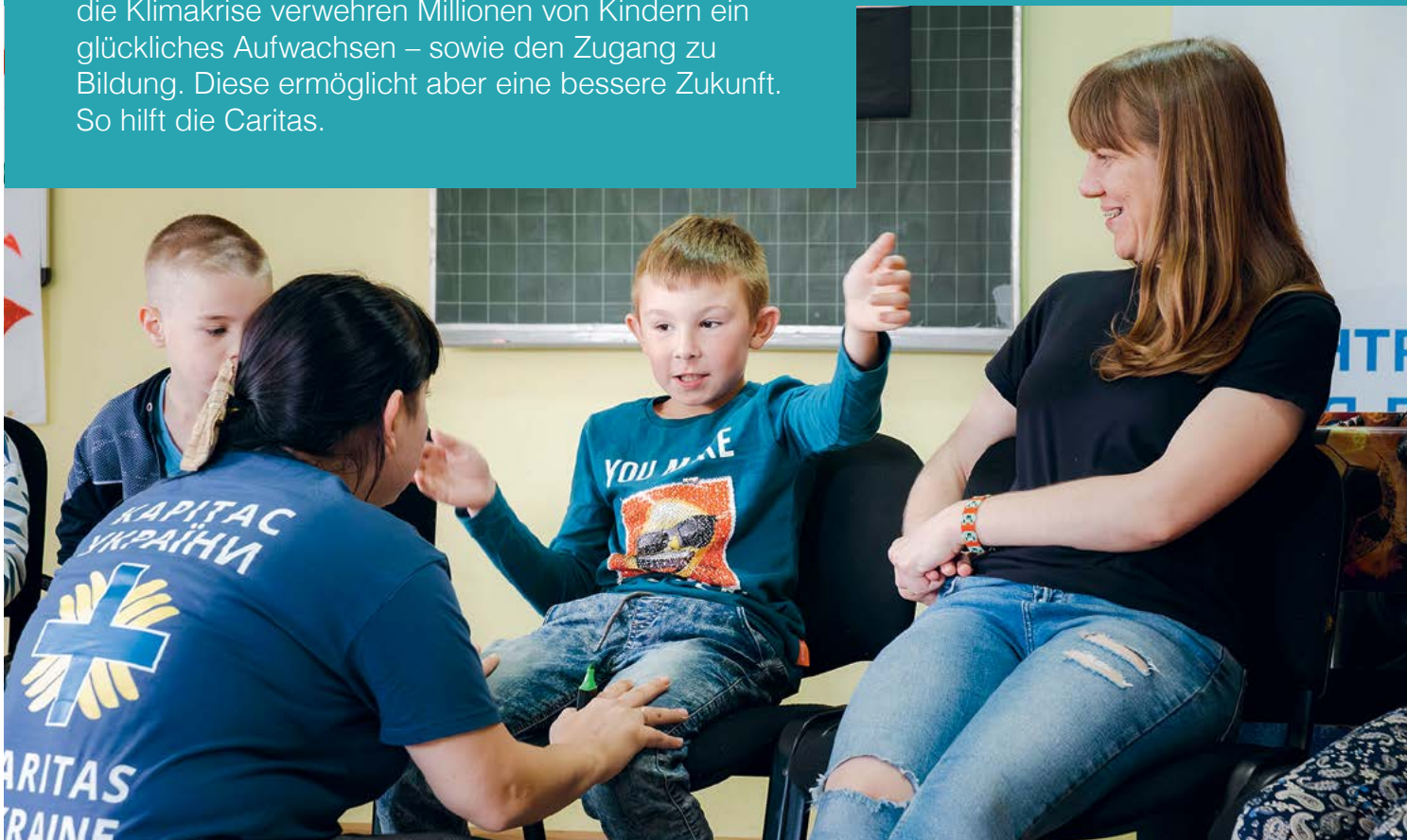
Die Caritas ermöglicht Kindern in Kriegs- und Krisengebieten Zukunftsperspektiven.

Ukraine, Nahost, Sudan. Kriege, Konflikte und auch die Klimakrise verwehren Millionen von Kindern ein glückliches Aufwachsen – sowie den Zugang zu Bildung. Diese ermöglicht aber eine bessere Zukunft. So hilft die Caritas.