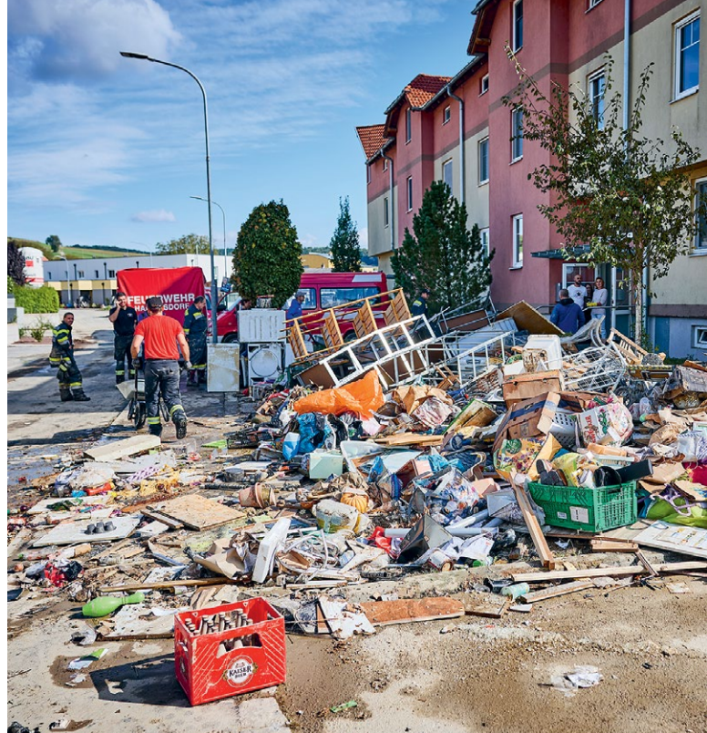
Betroffene standen nach dem Hochwasser vor den Trümmern ihrer Existenz.

Nach den ersten Tagen, als das Wasser sich zurückzog, zeigte sich das volle Ausmaß der Zerstörung. Verwandte, Freund*innen und freiwillige Helfer*innen unterstützten beim Aufräumen, doch der Schock saß tief. Die