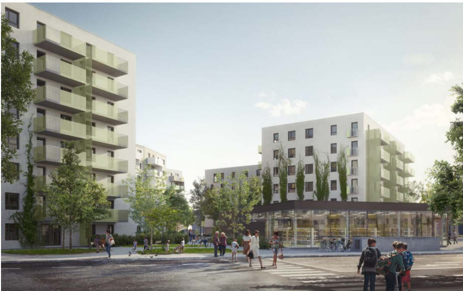
Visualisierung Kagraner Laberl © Simma Zimmermann

Wir freuen uns über dein Interesse an einer WG Melange und beantworten dir gerne alle deine Fragen. Du erreichst uns telefonisch oder via Mail: